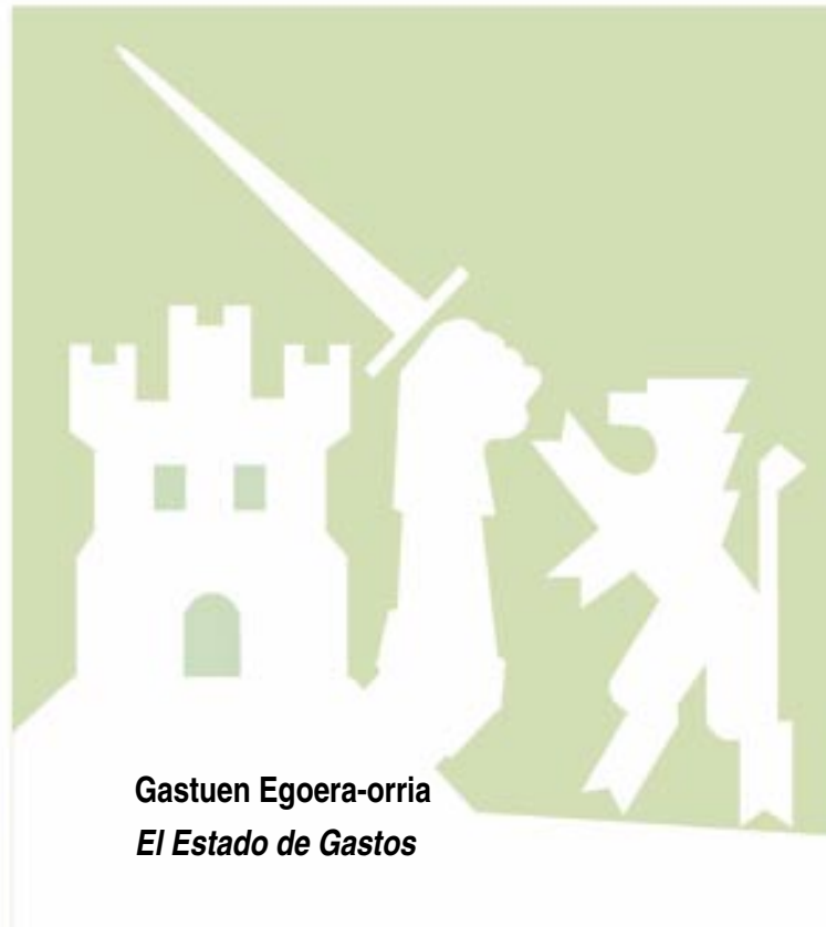
Gastuen Egoera-orria El Estado de Gastos