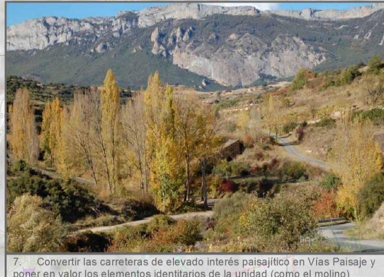
7. Convertir las carreteras de elevado interés paisajístico en Vías Paisaje y poner en valor los elementos identitarios de la unidad (como el molino)