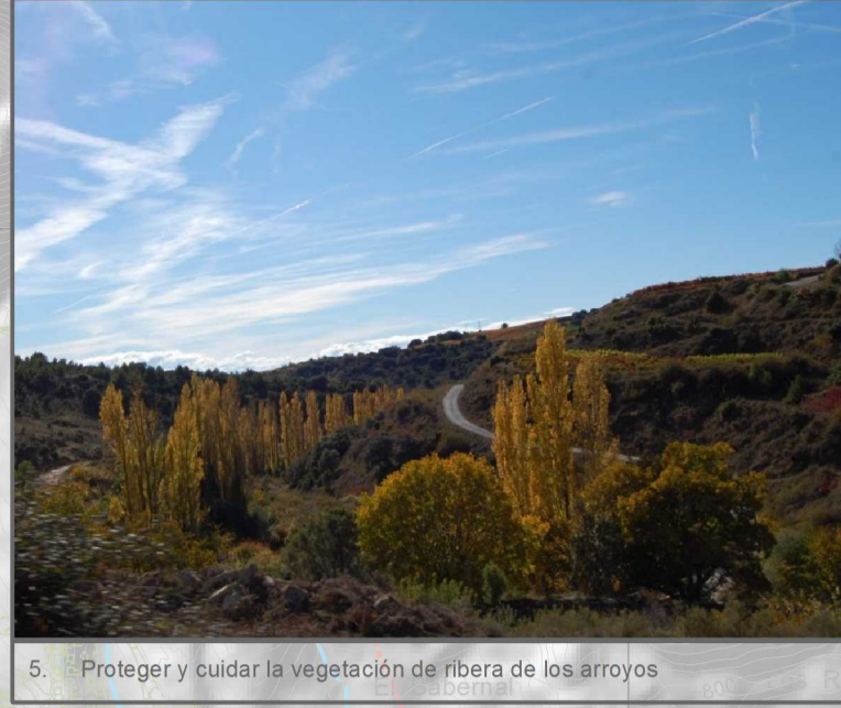
5. Proteger y cuidar la vegetación de ribera de los arroyos