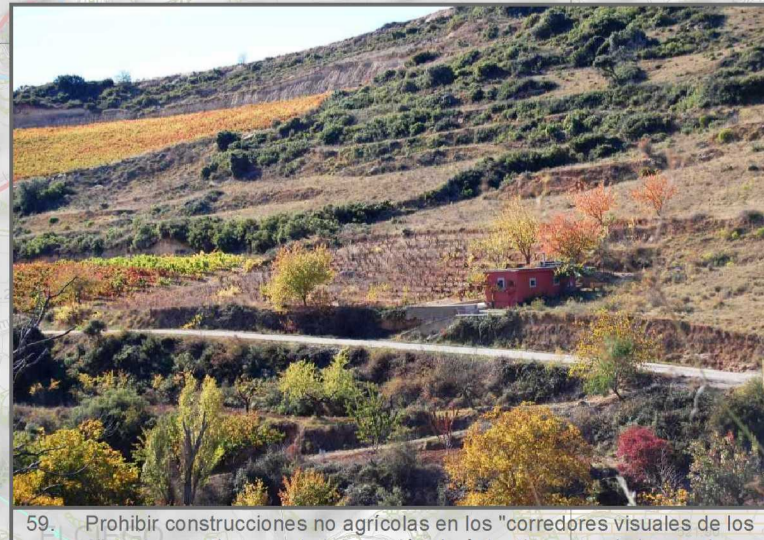
59. Prohibir construcciones no agrícolas en los "corredores visuales de los arroyos" y asegurar la correcta integración de éstas (como en la imagen)