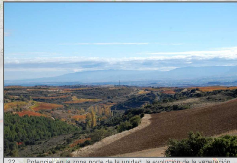
22. Potenciar en la zona norte de la unidad, la evolución de la vegetación natural arborea en las laderas y prevenir la vulnerabilidad a la erosión