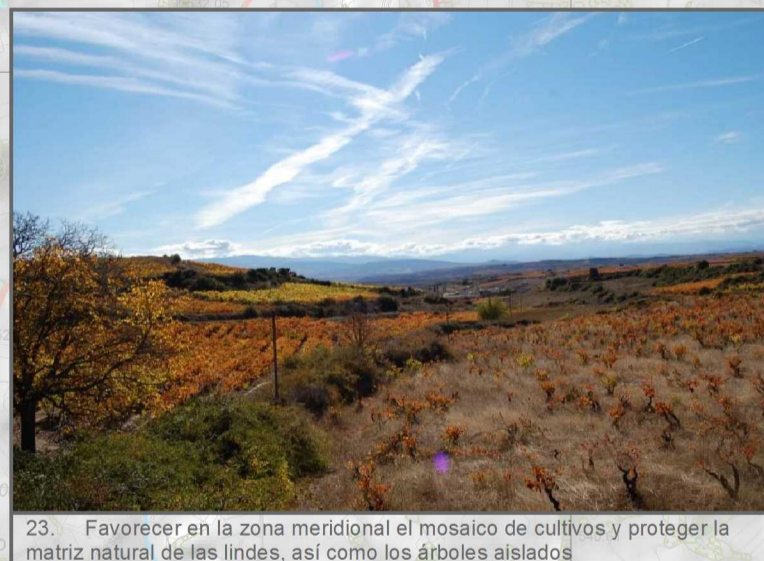
23. Favorecer en la zona meridional el mosaico de cultivos y proteger la matriz natural de las lindes, así como los árboles aislados