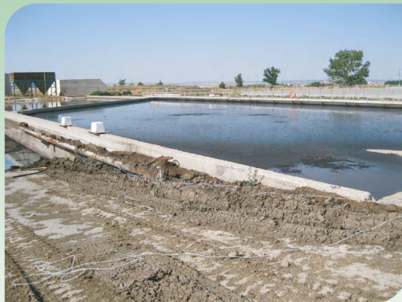
NEIKER. Nekazaritza Ikerketa eta Garapenerako Euskal Erakundea.

Gorozkiak modu likidoan maneiatu behar badira, itxitako hobi estanko bat (modu naturalean edo artifizialean) eduki beharko da horiek biltzeko eta biltegitratzeko, edo sistema baliokide bat. Lurrazaleko urak iragazteko eta kutsatzeko arriskua saihestuko da, gainezka eginda, galerarik ez dela gertatuko ziurtatuz.