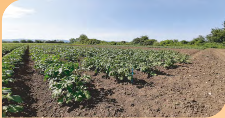
NEIKER. Nekazaritza Ikerketa eta Garapenerako Euskal Erakundea.

Ur ibilguetatik hurbil dauden lurretan ongarriak aplikatzeko, gutxienez 3 metroko zerrenda errespetatu behar da ongarritu gabe, aspertsoreekin, ongarrigailuekin, lainoztagailuekin edo banatzaileekin aplikatzen direnean, eta gutxienez 5 metrokoa , kanoiarekin aplikatzen direnean.