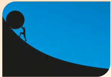
Pixabay (Creative Commons Lizentzia).

Debekatuta dago ongarri mota oro aplikatzea, minerala zein organikoa, urak hartutako lurretan, izoztuetan edo elurtuetan.