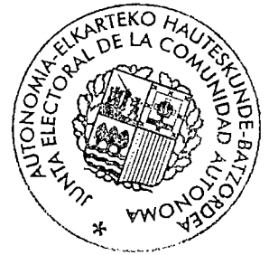
Andoni Iturbe Mach