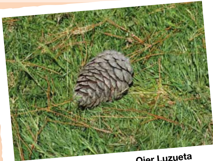
1. SARIA / 1er PREMIO