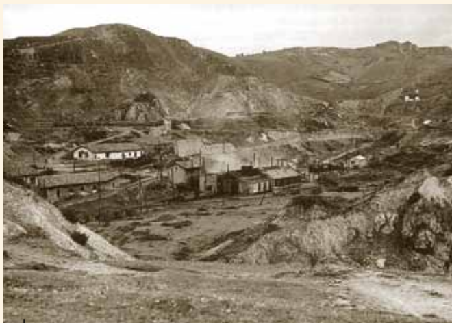
Taller de máquinas e instalaciones de Orconera (La Arboleda, mediados s. XX).