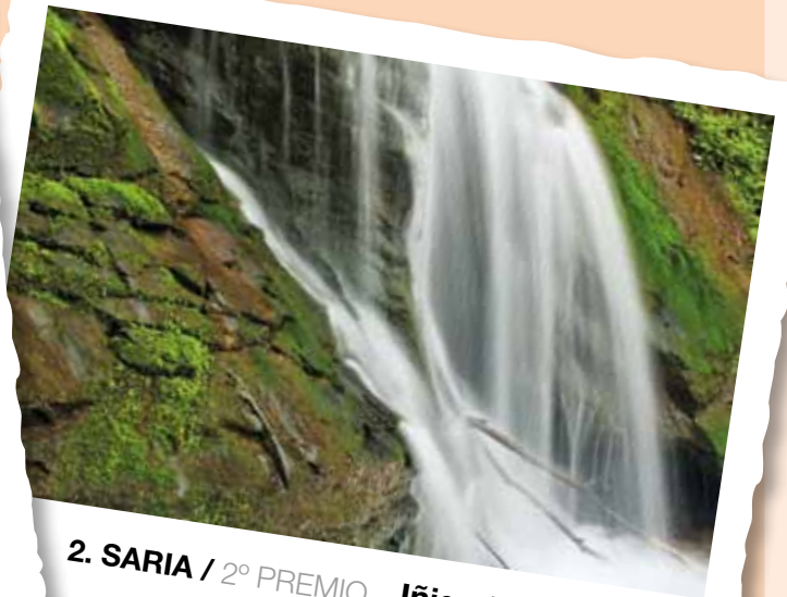
2. SARIA / 2º PREMIO