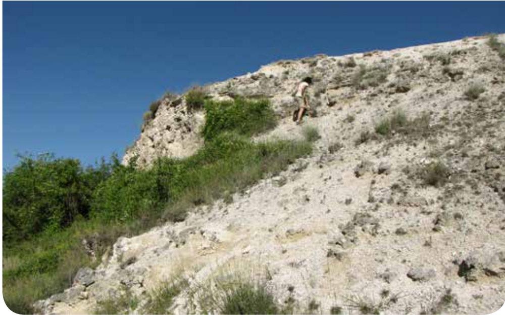
Formazioaren hegoaldeko ezponda.