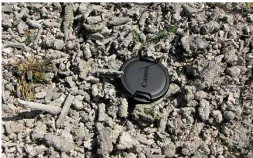
Landare-jatorriko eta hodi-formako elementu kaltzifikatuz osatutako lagin baten xehetasuna.