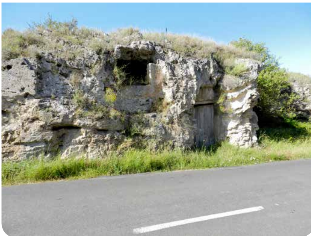
Trabertinoen metakinean zulatutako haitzulo bat.