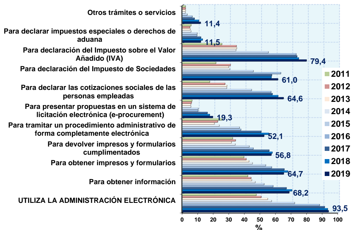
Establecimientos que han utilizado la Administración Electrónica por tipo de gestiones realizadas en el último año. C.A. de Euskadi. 2011-2019. %

Fuente: Eustat. Encuesta de la Sociedad de la Información en la Administración-ESIA