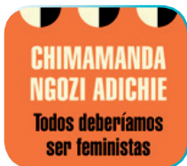
Literatura Random House Lengua: Castellano Año edición: 2015

Chimamanda Ngozi Adichie , nos habla en este libro, desde su doble condición de mujer y africana, de lo que significa ser feminista en el siglo XXI. Con humor e inteligencia y un estilo directo basado en experiencias personales, esta carismática autora Nigeriana rompe con los es-