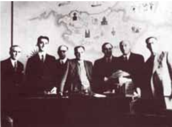
Delegación del Gobierno Vasco en París durante el Aberti Eguna de 1945.

men y se democratizaran. Tal como acabaría sucediendo pero, desgraciadamente, mucho más tarde."