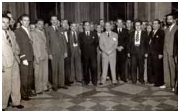
Julio de 1937. En un encuentro con el Gobierno de la Generalitat con Companys al frente.

José Antonio de Aguirre era considerado, incluso por sus adversarios políticos, como un político hábil en suscitar el consenso más allá de las discrepancias ideológicas. Destaca Iñaki Aguirre algunos de sus logros políticos más señalados: "El primer Estatuto de Autonomía Vasco de la historia, fruto de su negociación personal con el líder socialista Indalecio Prieto; el presidir, en la guerra como después durante largos años en el exilio, un Gobierno Vasco ampliamente multipartidista y sin embargo cohesionado; el trabajo político que desarrolló en América primero, después, en Europa, para lograr una mínima unidad de acción, entre los republicanos españoles