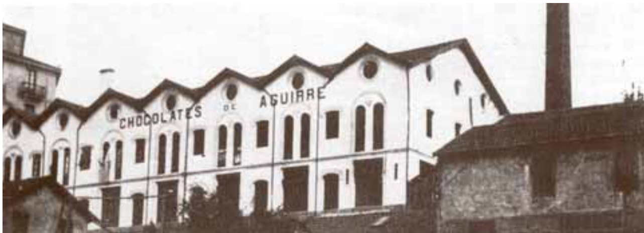
Vista general de la empresa familiar situada en la travesía del Tívoli de Bilbao.