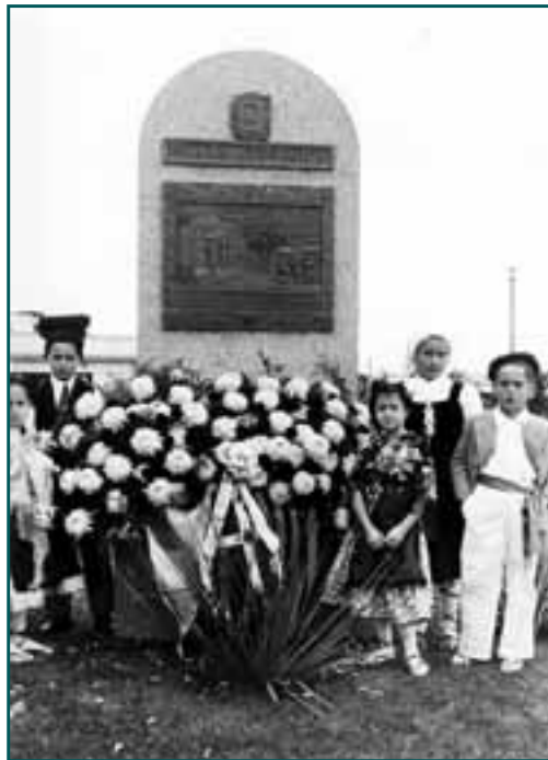
Inauguración de la Plaza Gernika en Montevideo, 1944.

Sociológicamente, “aquel grupo de exiliados vascos –comenta Xabier Irujo– estaba integrado por personas de todas las clases sociales. Existía, no obstante, una gran afinidad política entre ellos y la lucha por los derechos