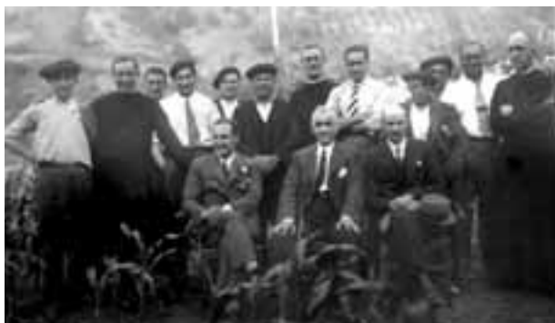
El mundo de las relaciones personales de Aguirre, tanto en el ámbito nacional y estatal, como en el internacional, fue muy rico e intenso.

Con relación a su sensibilidad social, hay que decir que la fábrica de chocolates, “Chocolates Bilbaínos, S.A.”, fue constituida en 1920 por cuatro fabricantes de chocolate, cuyas marcas eran: “Martina Zuricalday”, “La Dulzura”, “Caracas” y “Chocolates de