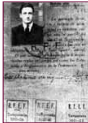
Carnet de jugador del Athletic de Bilbao, octubre de 1921

Durante su trayectoria futbolística, el Athletic de Bilbao se vio sumido en una transición, ya que no conse-