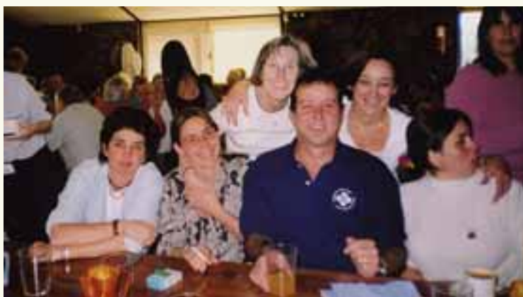
Un grupo de miembros de la Asociación Vasco-Venezolana Simón Bolívar.

mas es una sidrería que se sale un poco de la tradición y ofrece así mismo "kupelas" que contienen vino rosado y cava (o "agua de Bilbao", como también se le llama en Bizkaia a esta bebida burbujeante).