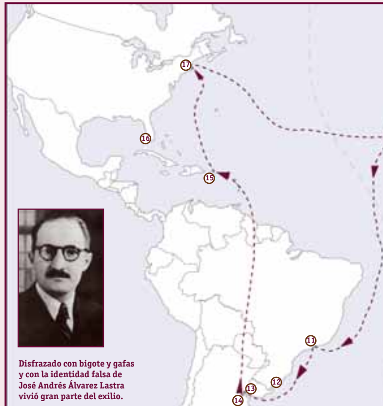
ETAPAS DEL EXILIO: 1. Santander; 2. Biarritz; 3. Barcelona; 4. París; 5. La Panne (Bélgica); 6. Amberes; 7. Hamburgo; 8. Berlín; 9. Sassnitz (Alemania);