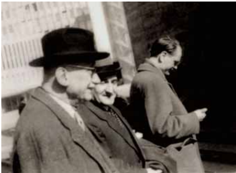
En la imagen, junto al político francés Robert Schuman, uno de los padres fundadores de la Europa actual. Berlín 23 de marzo de 1956

“unidad de los vascos”, “capacidad propia de decisión sobre su destino” y “defensa de la democracia en todo el mundo”, entendiéndola ésta como un derecho común y perfeccionable, por cuanto que nada existe en este mundo que no sea mejorable.