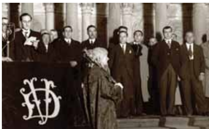
Juramento en Gernika como primer Lehendakari.

Desde principios de año, el Gobierno Vasco ha venido promoviendo actividades, ya sea de forma individual o en colaboración con otros organismos. Entre los actos que se han celebrado ya, destacan la colocación de una escultura en la Plaza Moyúa de Bilbao, la publicación de un libro bajo el título "La vida del Lehendakari Aguirre" por iniciativa del Ayuntamiento de la capital vizcaína, o una exposición organizada por la