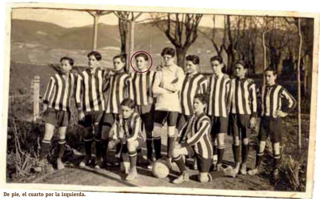
De pie, el cuarto por la izquierda.