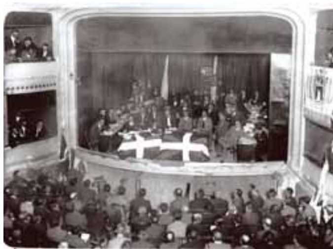
Presentación del anteproyecto del Estatuto en Estella. 14 de junio de 1931.

Por esos años, las fuentes doctrinales principales, José Antonio de Aguirre y su generación las encuentran en la doctrina social de la Iglesia Católica y en la amplia literatura del cristianismo social, en la posición, de enorme influencia doctrinal en los círculos católicos democráticos y nacionalistas de entonces, del cardenal belga Mercier frente a la invasión alemana de su país en la Primera Guerra Mundial. Una inspiración que después nu-