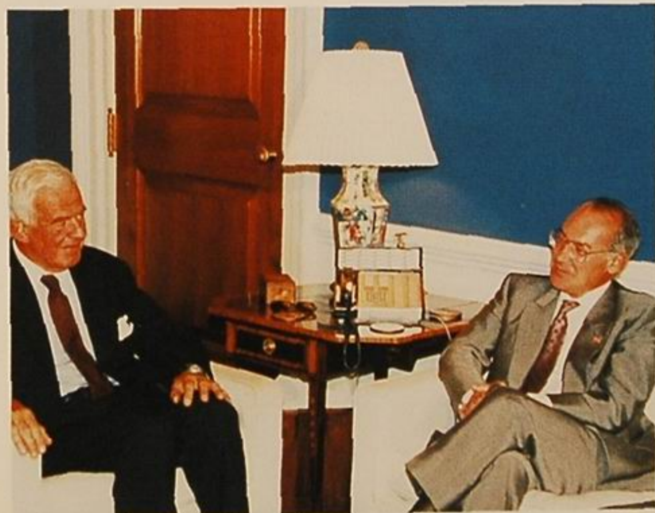
El Lehendakari con el Presidente del Congreso de los Estados Unidos, el speaker Foley.

Para valorar en su justa medida el apoyo que la emisión de