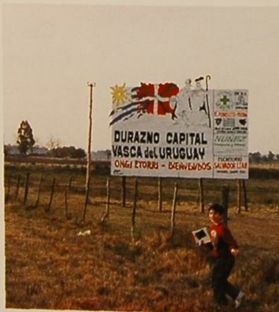
Cartel situado en la ruta de entrada a Durazno.