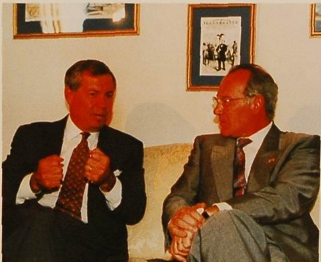
El congresista por Idaho, Larry LaRocco, explica al Lehendakari la situación política americana.

Además mantuvo entrevistas con el senador Christopher Dodd, miembro del Comité de Exteriores del Senado, acompañados por el