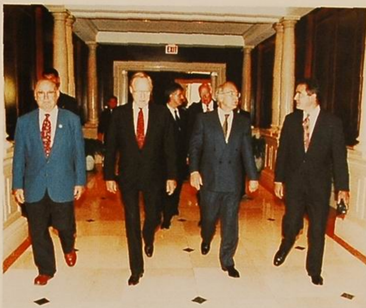
El Lehendakari con miembros de la ABF en los locales de Pennsylvania Avenue.

Destacar también las visitas de Ardanza a la fábrica de helicópteros norteamericana Sikosky, en Connecticut. Una empresa que tiene fuertes relaciones con