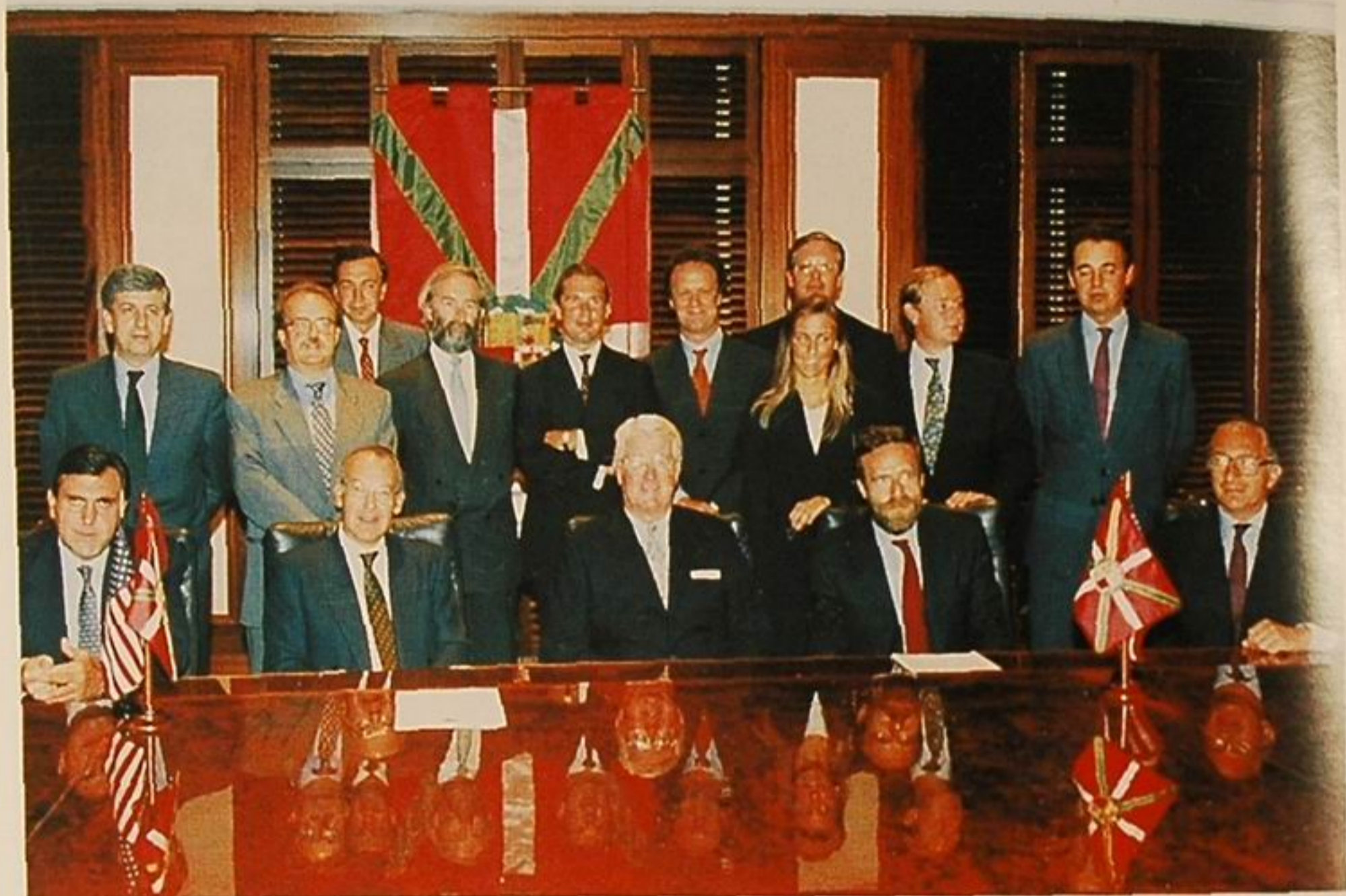
"Foto de familia" tras la firma de la Emisión de Deuda Pública Vasca en New York.