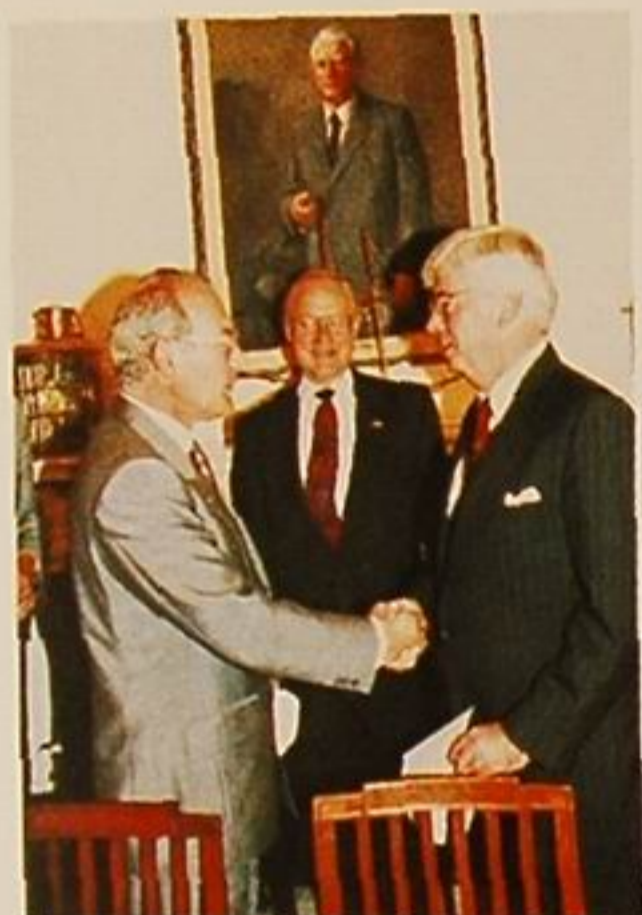
El Lehendakari saluda al vicepresidente USA, Al Gore.