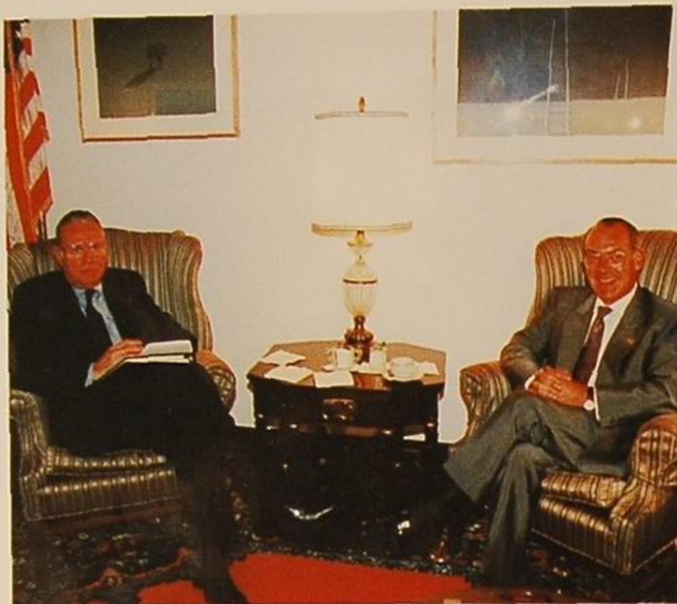
El Lehendakari mantuvo contactos al más alto nivel.