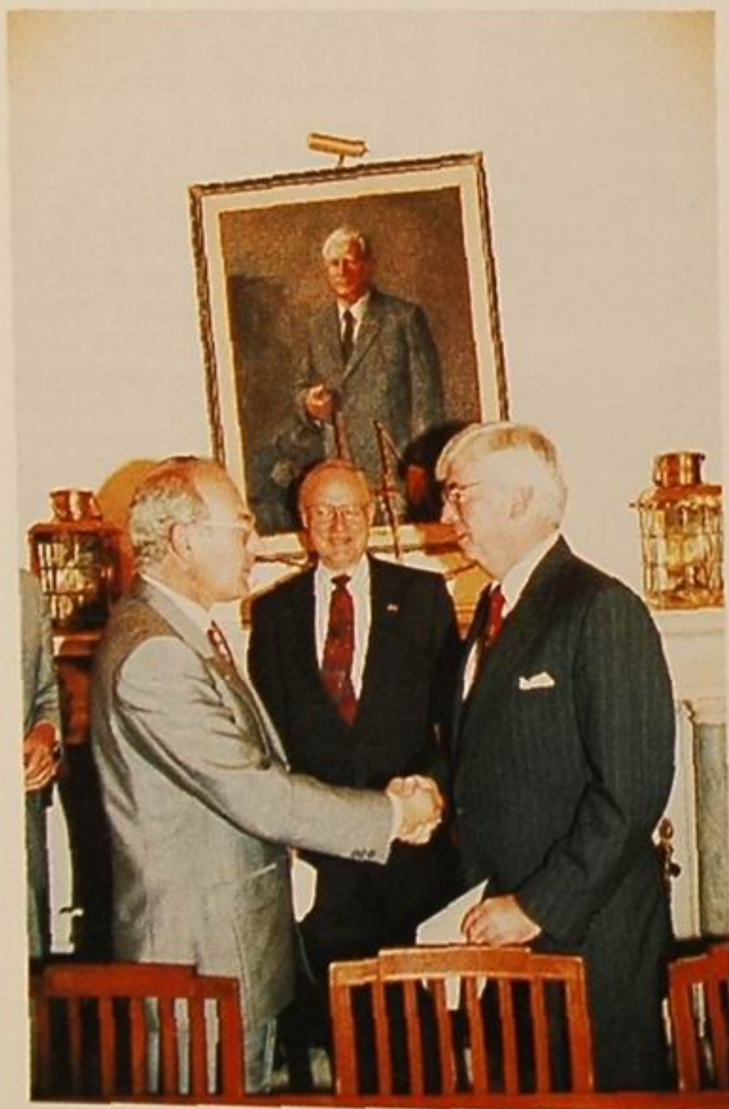
El Lehendakari se entrevistó con el influyente senador Dodd, especialista en política internacional

1995 Euskadi, invitación que fue aceptada por el político americano.