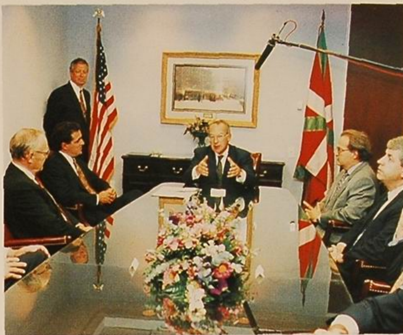
El Lehendakari durante el acto de inauguración de la ABF.

La emisión se ha lanzado al mercado americano suscrita por