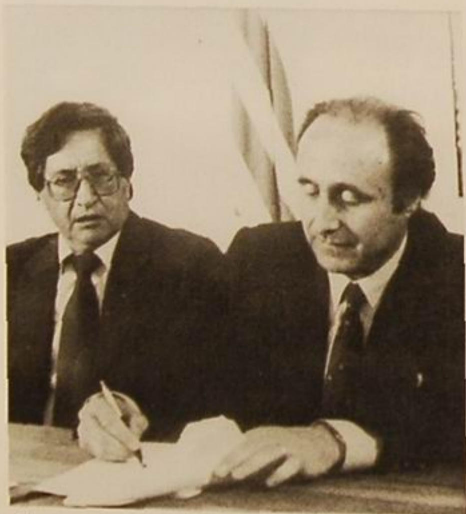
Firma del convenio con el M.T.O.P., para reformar la sede de Euskal Etxea.

Este año los fondos recaudados durante los actos se destinaron a la Asociación de Sordos de Durazno, AUPI, la Escuela de Re-