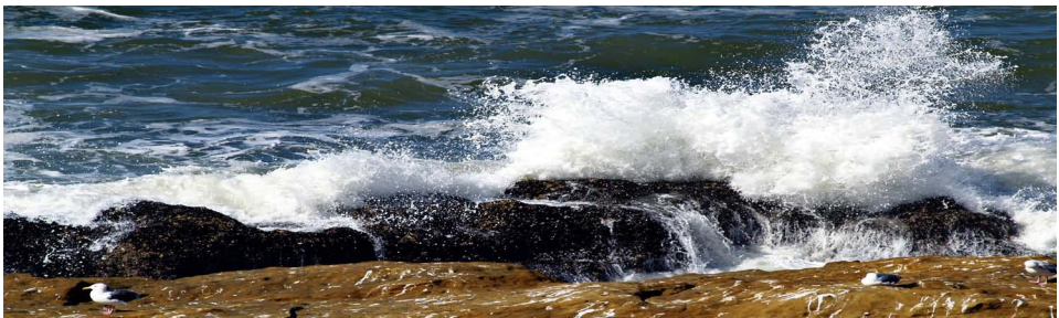
Ubarroi mottodunak eta kaioak aldiz, itsaslabarretan hartzten dute atseden

Por otro lado, aunque la biodiversidad del biotopo sea muy notoria, las poblaciones de vertebrados tienen difícil el asentamiento por la pequeña superficie del biotopo. Sobre un terreno bastante grande de la marisma se creó el campo de golf con un efecto directo en las poblaciones de plantas y animales.