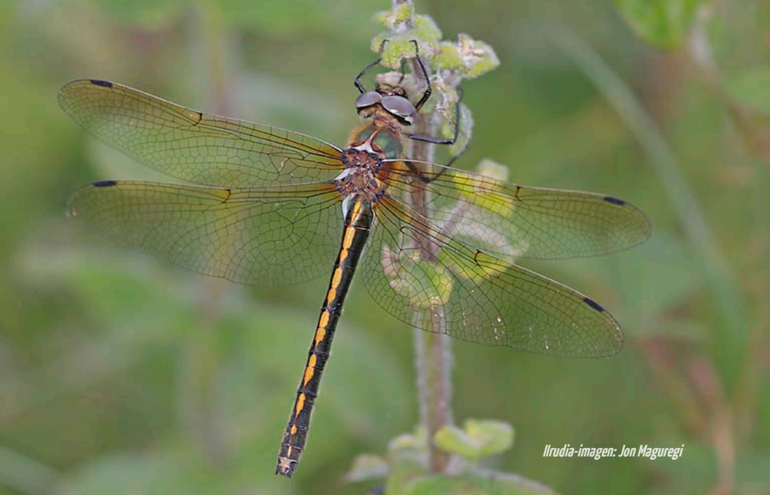
Ilrudia-imagen: Jon Maguregi

Intsektuak oso ugariak dira ekosistema honetan, ura nahitaezkoa baitute bizi-zikloa osatzeko; hauen larbak uretan bizi dira (adibidez sorgin orratzarenak).