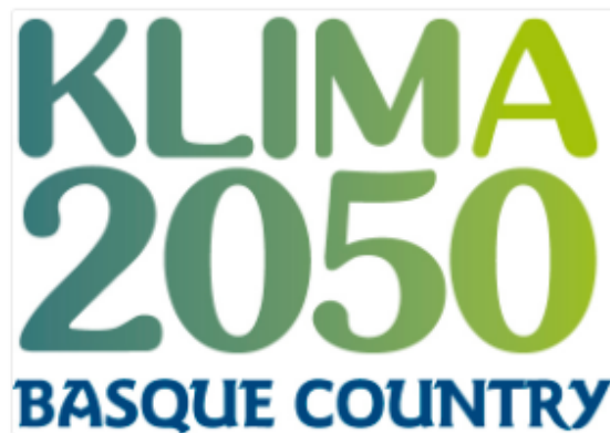
Estrategia vasca de cambio climático 2050