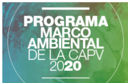
Programa marco ambiental